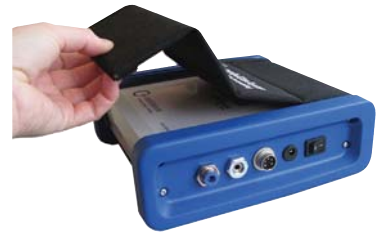
Práctica cubierta protectora incluida