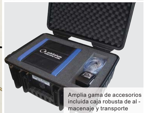
Amplia gama de accesorios incluida caja robusta de almacenamiento y transporte

El método de "medición óptica de oxígeno por extinción de la fluorescencia" para la tecnología de soldadura (pendiente de patente), es muy superior a los métodos convencionales, utilizando sensores de circonio: no requiere tiempo de calentamiento en absoluto; de manera fiable, rápida y precisa, detecta la proporción de oxígeno en el gas; se elimina el supuesto aumento descontrolado del valor de la medición debido a la formación de ozono; la medición es posible con todas las mezclas de gas sin cambiar manualmente (incluso con gas inerte con un porcentaje variable de hidrógeno).