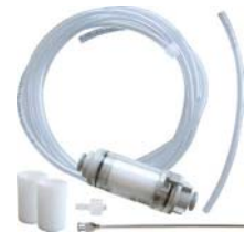
Set manguera medición (Piezas individuales disponibles por separado)